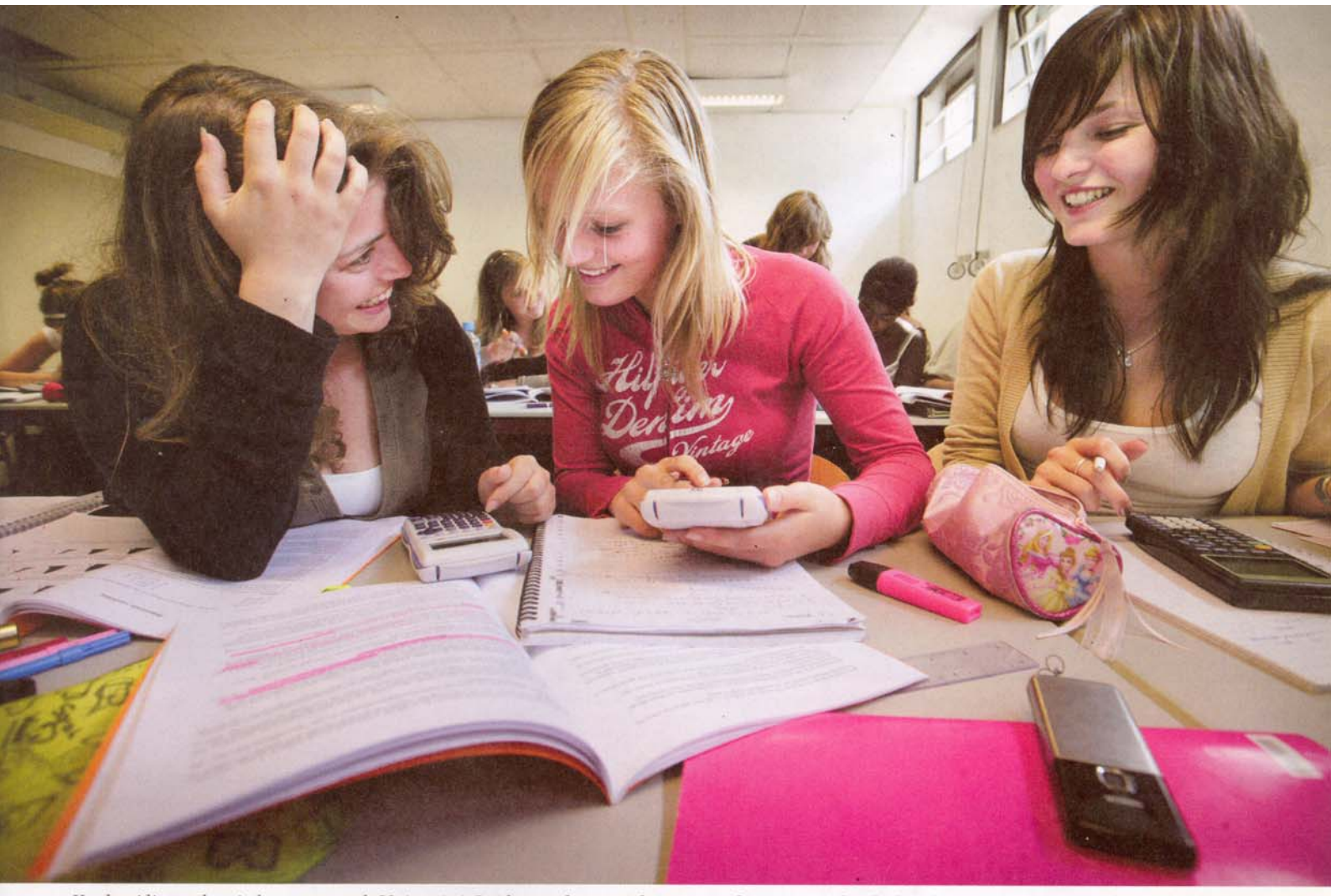
Voorbereiding op het eindexamen aan de Universiteit Leiden: studeren zonder msn, zonder tv, en met begeleiders die vaak maar een paar jaar ouder zijn dan hun leerlingen